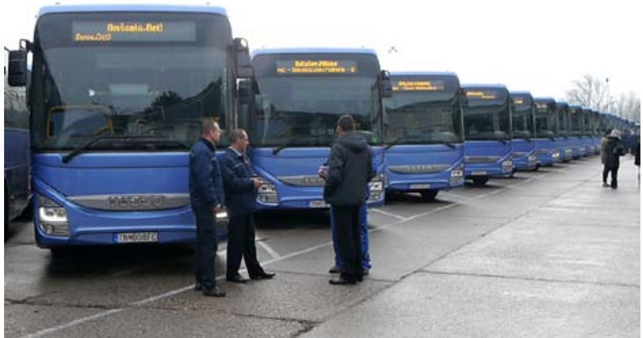
foto Trenčiansky terajšok - Nové autobusy pripravené na odovzdanie do

Vedenie SAD-ky prejavilo do budúcnosti záujem aj o elektro-autobusy. Ako sa cestovalo pred polstoročím, pri nových moder-