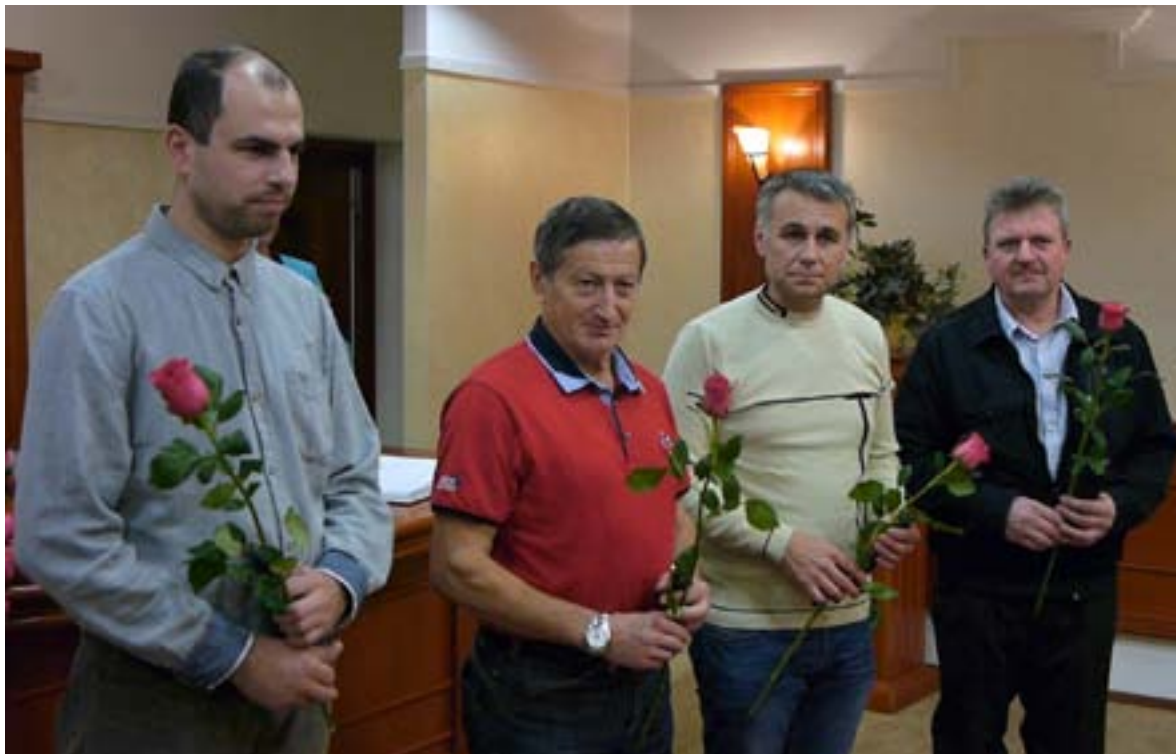
Držiteľia diamantovej Janského plakety

V Trenčíne odovzdali darcom krvi zlaté a diamantové Janského plakety. Táto slávnosť sa konala v deň 25. výročia založenia Domu humanity v Trenčíne.