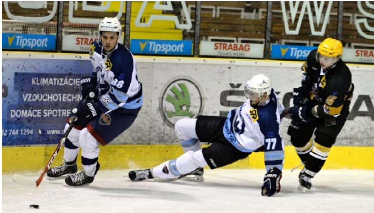
2.kolo EUHL 23.10.2016 – Gladiators Trenčín – Akademi Plzeň 3:9 (1:1, 0:2, 2:6)

Univerzitné hokejové mužstvo spod hradu Matúša Čáka Gladiators Trenčín neodštartovalo štvrtý ročník EUHL (Európska univerzitná hokejová liga) na domácom ľade práve najlepšie.