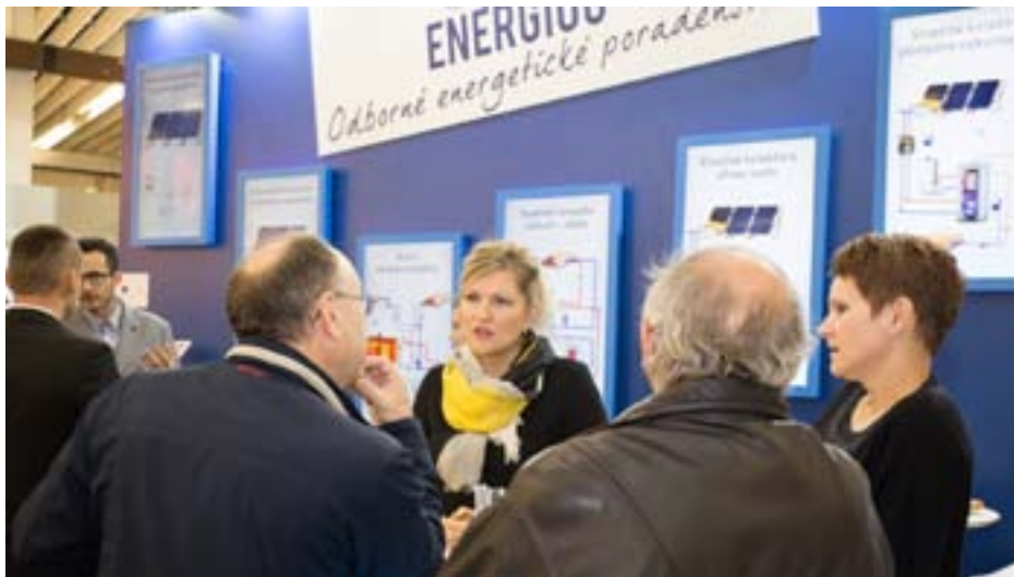
Bezplatné energetické poradenstvo bolo k dispozícii aj počas veľtrhu ELO SYS 2016, ktorý sa konal na trenčianskom výstavisku v októbri. Možnosť získať užitočné odporúčania využili desiatky záujemcov.

Výraznejšie úspory energie sú zvyčajne spojené s opatreniami, do ktorých sa neoplatí púšťať bez konzultácií s odborníkmi. Ak zvažujete, či sa vám oplatí zatepliť alebo chce rekonštruovať vykurovací systém, či investovať do využívania obnoviteľných zdrojov energie, základom